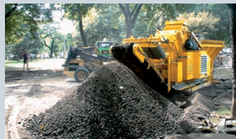
Réussite basée sur la qualité : jusqu'à 80 t/h de granulats cubiques de qualité à partir de gravats, d'asphalte, de béton, de briques et autres matériaux