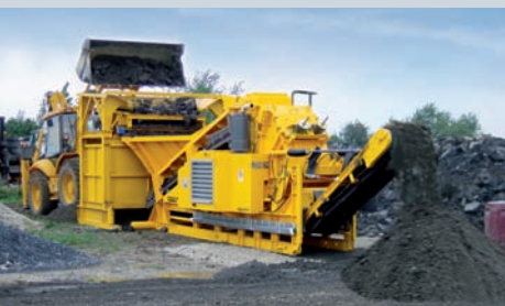
Usure réduite grâce au précrible : le VS60 robuste – avec bande latérale au choix – sépare les fines du matériau à concasser

d'entretien peuvent être effectués à partir du niveau du sol. Avec des composants performants en option tels que scalpeur et crible de classement, on obtient un centre complet de recyclage. L'entrepreneur en construction, pavage ou démolition devient un fournisseur de services pour les entreprises et les collectivités et crée des circuits de recyclage courts et avantageux. Les partenaires RM partout dans le monde conseillent en matière de réglages et de logistique de chantier en fonction du type d'intervention.