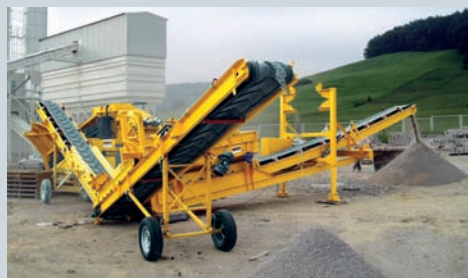
Créneaux rentables : les déchets de production sont classés par le CS2500 mobile de type conteneur et transformés en produits finis à haute valeur marchande